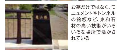
お墓だけではなく、モニュメントやトンネルの銘板など、東和石材の高い技術がいろいろな場所で活かされている