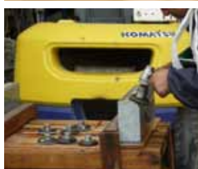
施主様の希望をできるだけ反映させるのもお墓のディレクターの大切な役目