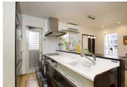
モデルルーム風景