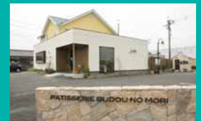
国道沿いにある、北風風の落ち着いた雰囲気のお店