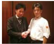
スタッフと共に歩む首藤社長。「その人の能力を一番活かせるステージを創ることが私の役割」と語る