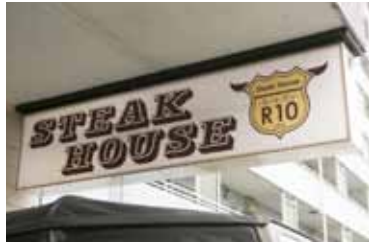
リピーターが多く、頻繁に通う常連客も多いという