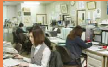
お客様や現場の状況を素早く察知して、先を見越した仕入れを行うことも