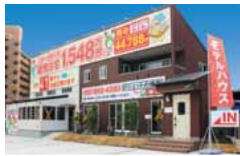
ジェットコーポレーション本社の外観