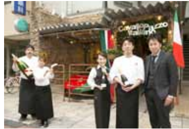
2月に開店した「カヴァーロパツォイタリアーノ」。本場イタリアで腕を磨いた日出町出身の料理人を招き、マネージャーには学生時代アルバイトスタッフとして勤務していた女性を抜擢