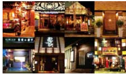
創作ダイニングやイタリア料理店など、ジェットの飲食店は個性あふれる店舗づくりが魅力

「土地を見てそこに合う住宅を直感で素早く決めます。「妄想力」ですよ(笑)」不動産部門の社員は7名。今後も集合住宅の開発や投資物件としての住宅の