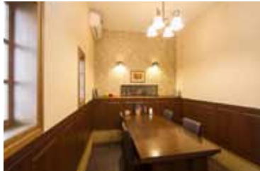
1950～60年代を模った店内。レトロでアメリカンなイメージは年配のお客さんにも好評という

アメリカンスタイルのステーキレストランをオープンして5年。1950～60年代のオールディーズをイメージした店内、自慢のTボーンステーキは、年配の常連客達にも人気でこの店の看板メニューとなっている。