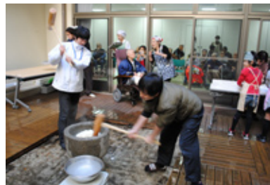
若いスタッフのつく餅つき大会で正月を祝う