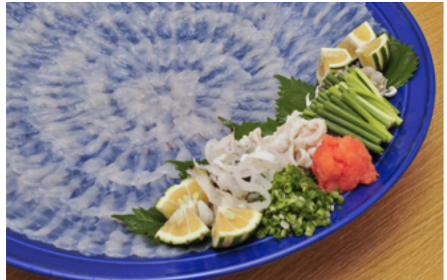
(上)1日1回の餌にジャンプするように飛び付いてくるフグの群れ

限りなく天然に近いフグは、プリプリとして弾力性がある。そのおいしさは、社長のなじみの店でも評判