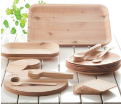
安全と安心を永く伝える天然素材製品

1975年の創業より「上質な日常」を基本テーマに、デザイン性の高い天然素材の商品を送り出してきた山下工芸。自然と共に歩んできた企業ならではのソーシャルビジネス(SB)に取り組んでいます。