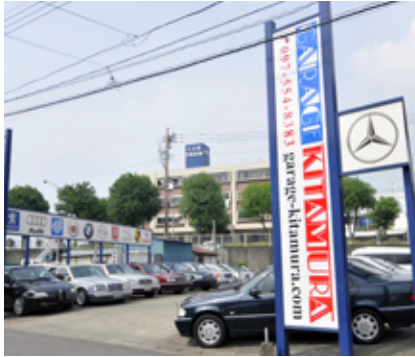
車好きなら一度は覗いてみたくなるのが、ガレージキタムラの展示場

20年以上前から、輸入車好きの期待に応えてきたガレージキタムラ。魅力は何といっても豊富なラインナップとネットワーク、そして北村社長のお客様の希望に応えようとする熱意です。