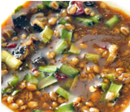
県産ニラを醤油麴に漬け込んだ餃子の素は麺にも合いそう

元の自動車部品の組み立て工場から、事業を刷新して染矢インテックスが着手したのは、農産物加工と販売でした。