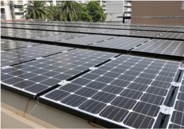
今、製造が追いつかないほどの売れ行きを見せる太陽光発電にもいち早く着手している