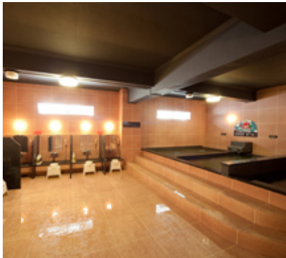
温泉は別府ならではの掛け流し。24時間入浴可能です

例えば近場で遊ぶ時、県外から来た親戚や友人をもてなす時、リラックスして思いきり楽しめる場所が欲しい。そんな思いに応えたのが、ここアミューズメントG-パレスです。