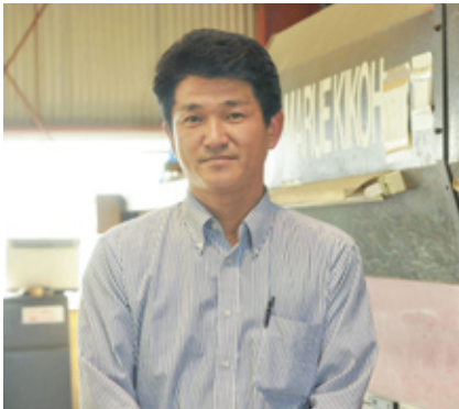
仕事の大小にかかわらず、県内外へ資材を供給している

創業から21年。屋根板金を主に、建築資材の販売と工事を請け負いながら、大分県内外の住宅、店舗、公共施設などの建築に幅広く携わってきました。業界では後発ながらも、大手企業にはない手の届く細やかなサービスと確かな技術力で、年々リピーターや口コミでお客様を増やしています。