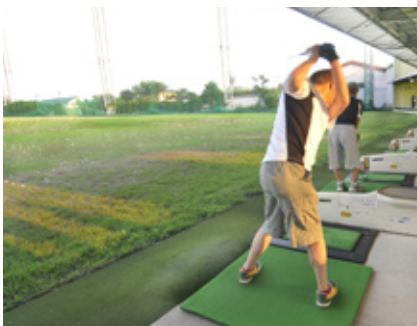
明るく、広々とした打席は、西日も北風も当たらない気持ちのいい環境

平日の夕方ともなると、学生からサラリーマン、OLまでが、次から次へとゴルフガーデン・イーグルに入っていきます。練習に来る年齢層は幅広く、下は10歳から、上はなんと95歳まで。人気の理由は「打ちやすい」環境にあるようです。