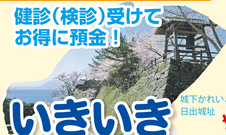
城下かれいと 日出城址