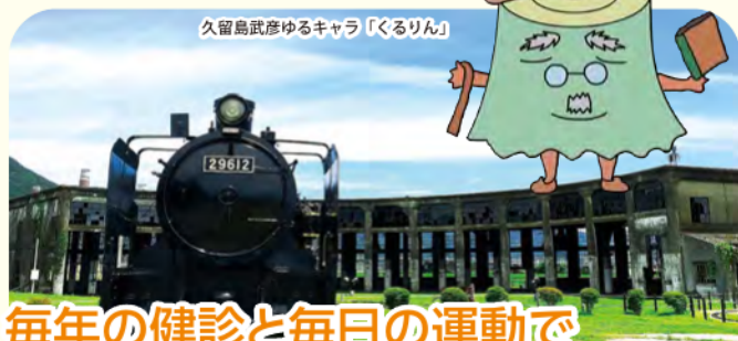
久留島武彦ゆかりのキャラクター「くるりん」