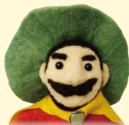
大分市減塩推進 キャラクター 減らしお ゲンさん

大分県信用組合は「健康寿命日本一おうえん企業」登録第1号として 大分県民の健康寿命延伸への取組を支援し地方創生に貢献します!