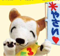
大分市野菜食べよう 推進キャラクター 350(さんごうまる)